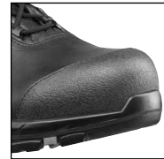
HAIX® Composite toe cap