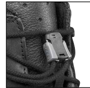
HAIX® Smart Lacing