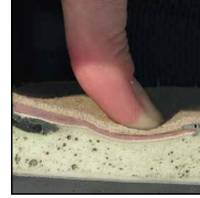
HAIX® MSL Sistemi