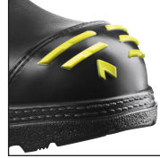
HAIX® High Durability Cap System