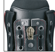
HAIX® Lacing System